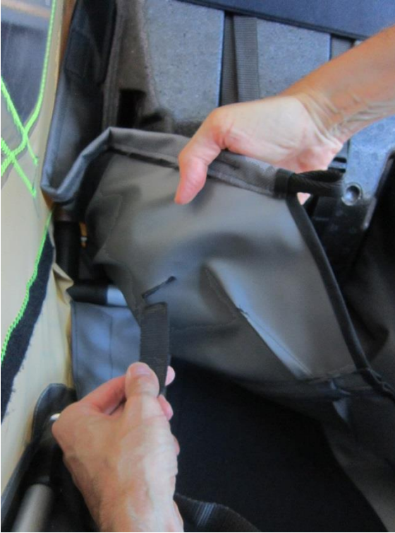
Nejprve skrze otvor v textilní vložce

Následně protáhněte zpět spodní část bočních popruhů skrze otvory v sedáku.