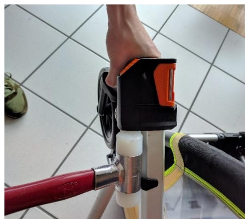
4. Gumovou paličkou lehce vyklepněte konzoli koleček