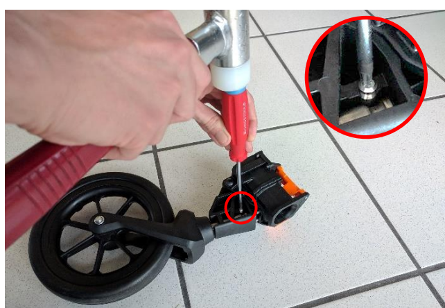
6. Osičku/váleček vyklepněte