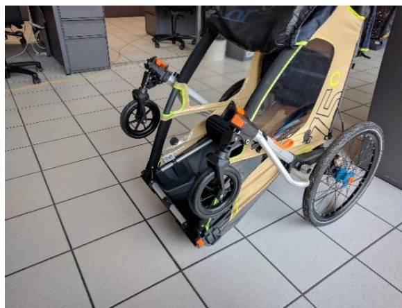
2. Vozík uveďte do mezipozice před složením