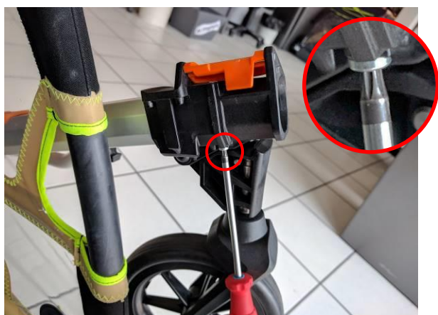
3. Klíčem TORX 20 vyjměte pojistný vrut