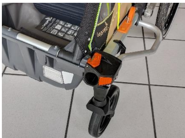
1. Demontujte cyklo oj

Tento návod popisuje demontáž konzole kočárkových koleček pro lepší přístup. Údržbu koleček lze provést i na vozíku (od bodu č.5).