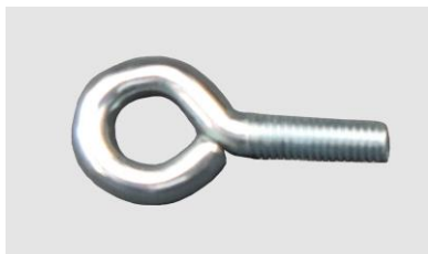
Artikel Nr. 10.30005.0003 Ringschraube M5 20 mm

Pro montáž miminkovníku potřebujete šroub M5 s očkem a maticí M5, které jsou součástí dodávky