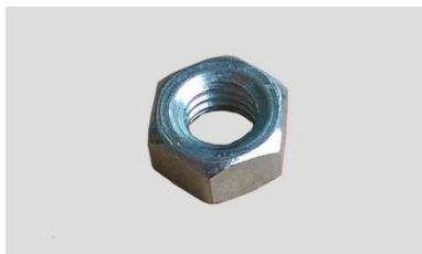
Artikel Nr. 10.30100.0001 Sechskantmutter M5