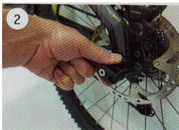
2 Zašroubujte lehce osu do rámu. Případně použijte mazivo.