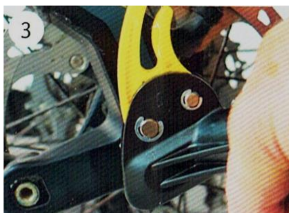
3 Po zašroubování osy a lehkém dotažení nasuňte cyklooj na spojku pevné osy.