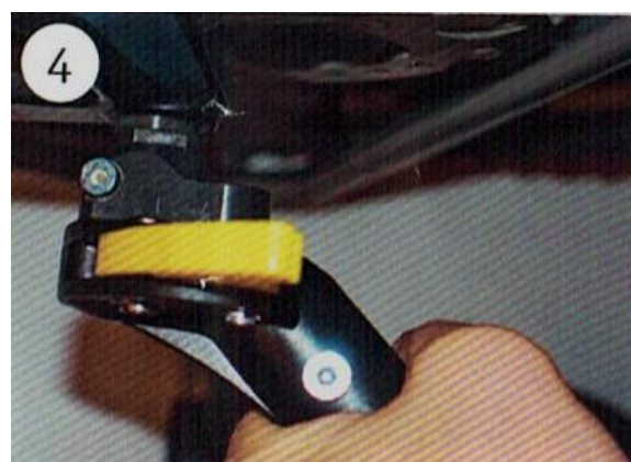
4 Cyklooj zajistěte žlutou bezpečností pojistkou, otočením ve směru hodinových ručiček. Pojistka musí zacvaknout.