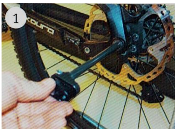
1 Zasuňte opatrně osu do náboje zadního kola